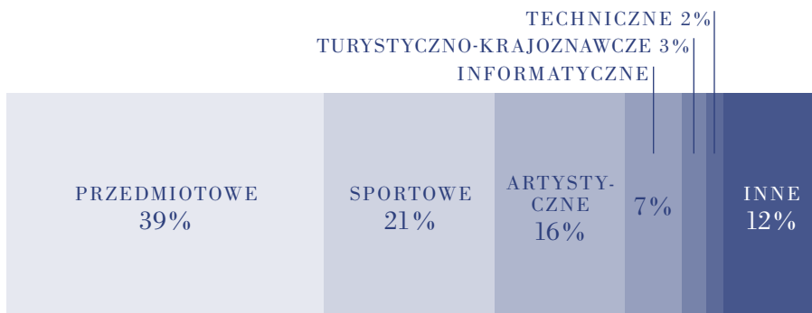
RYS. 1. Struktura zajęć pozalekcyjnych w szkołach (na podstawie danych GUS -8 ).

Ważnym i pozytywnym aspektem przemian edukacyjnych w Polsce jest systematyczny wzrost liczby zajęć pozalekcyjnych. Jak wynika z danych opublikowanych przez GUS, -7 w roku szkolnym 2010/2011 funkcjonowało w szkołach 291 tys. szkolnych kół, klubów i zespołów prowadzących zajęcia pozalekcyjne i nadobowiązkowe, co stanowi wzrost o 12% w stosunku do roku poprzedniego. Znaczącą część tej oferty stanowią zajęcia artystyczne (por. rysunek 1). ++ Niestety, istniejące statystyki nie pozwalają precyzyjnie określić, jaką część tych zajęć stanowią zajęcia muzyczne. Z prowadzonych szacunków sądzić można, że w przybliżeniu połowę.